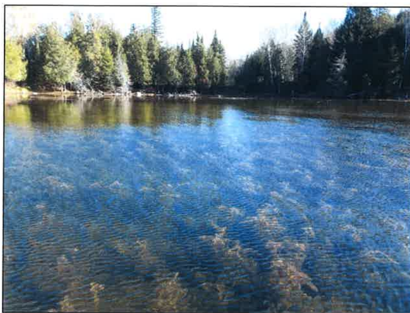
Colonie de myriophylle à épi dans la Baie de Knight, Gracefield

Le myriophylle à épi est une plante herbacée aquatique vivace qui vit submergée et se reproduit principalement par fragmentation végétative. La fragmentation de la plante se poursuit pendant une bonne partie de l'année et les racines se développent souvent sur un fragment avant que celui-ci ne se détache de la plante mère. Le myriophylle à épi peut pousser dans des plans d'eau d'une profondeur allant de 0,5 à 10 mètres, mais la plupart des plants semblent s'établir à une profondeur se situant entre 0,5 et 4,5 mètres. La transparence de l'eau évaluée à 6,2 mètres de profondeur contribue en quelque sorte à la prolifération de la plante en profondeur car la lumière pénètre plus profondément dans la zone littorale et ainsi fournit une partie de l'énergie lumineuse nécessaire à la plante pour proliférer.